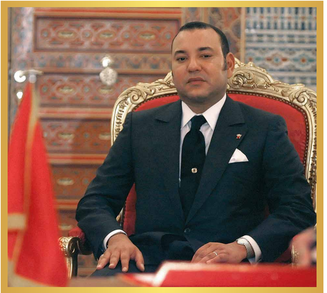
SA MAJESTE LE ROI MOHAMMED VI